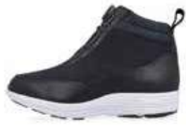
834-898-830 Mørk blå