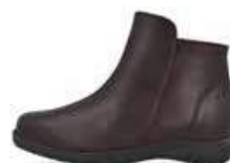
383 Mørk brun