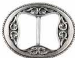
AP 00061 | DAME

Vakkert utformet spenne i et populært design.