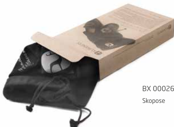
BX 00026 F

En klassisk spenne med blomstermønster til barnesko.