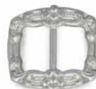
AP 00123 | BARN

Vakker utformet spenne i klassisk design, inspirert av de første bunadskoene Klaveness produserte.