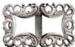
AP 00023 | DAME

“Borrestilen” var en del av vikingtidens ornamentikk. Dette stilrene mønsteret ble funnet ved en gravhaug ved Borre i Vestfold (Mønsterbeskyttet reg. 74998).