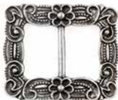
AP 00069 | HERRE

Denne spennen er laget i messing og er tradisjonell og tidløs. Perfekt for den som ønsker seg en gyllen spenne.