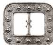
AP 00071 | DAME

Denne spennen tar opp et mønster fra gammel norsk tradisjon.