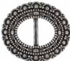
AP 00124 | DAME

Nålspenne utformet i tradisjonelt og tidløst design.