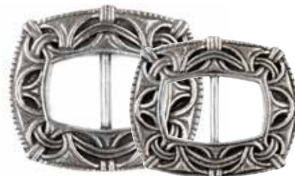
AP 00022 | HERRE; AP 00067 | DAME

Spennen er en viktig del av skoen. Denne kommer fra Valdres, og mønsteret kan spores tilbake til 1800-tallet.